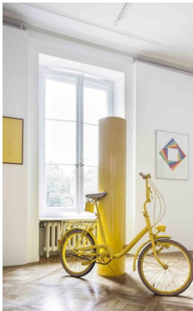
Hans-Rudolf Huber, Vélo , 1975

Ce vélo jaune, adossé à un poteau de la même couleur, fut présenté lors d'une exposition de sculpture en plein air à Bienne en 1975.