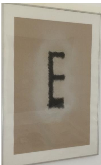
Muriel Olesen, Sans titre (E) , 1973