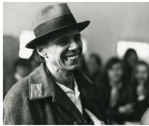
Photo de Joseph Beuys