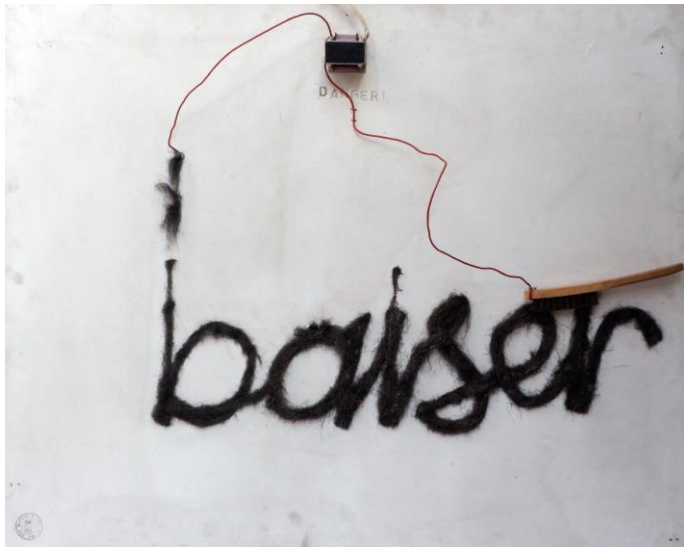
Gérald Minkoff, Baiser , L'art ne peut être restreint , 1972

Parmi les tableaux exposés à la Villa, certains présentent des formes géométriques exécutées avec rigueur (voir la salle où se trouve le Vélo de Hans-Rudolf Huber), d'autres en revanche utilisent des lettres, des mots.