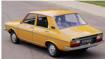
Le Renault 12 est la voiture la plus vendue en France dans ces années-là.