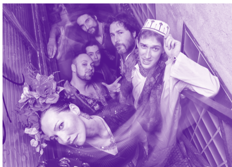
Gypsy Sound System Orkestra