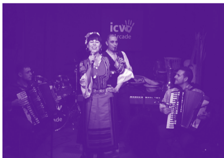
Ensemble Parfum Bulgare