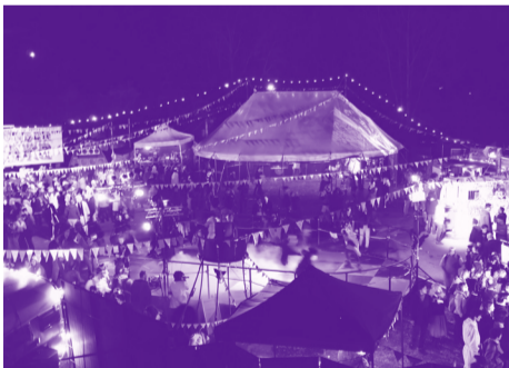
La Fête à Toto