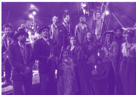
Electric Bazar Cie