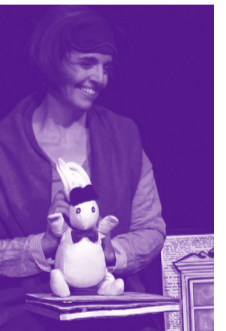
Cie Au petit bonheur les mots