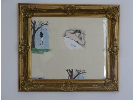
Robert Gober Hanging man/Sleeping man 1989 lé de tapisserie (coll. particulière)

Denis Savary Rue impression sur papier micro-perforé et contre plaquage sur aluminium