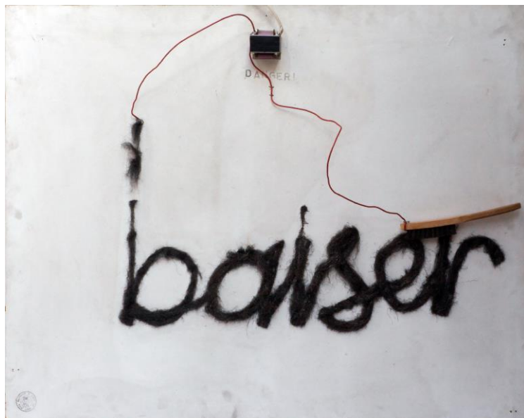
Gérald Minkoff, Baiser , 1972, coll. André L'Huillier

Exposition à la Villa Bernasconi | 5 septembre — 25 octobre 2015