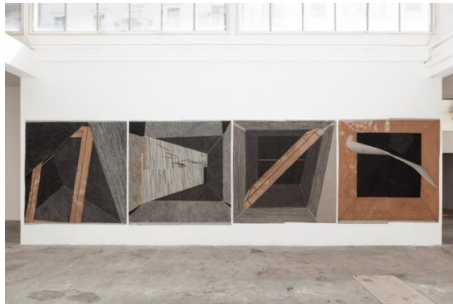
Virginie Delannoy, sans titre , 2017, fusain et scotch sur papier