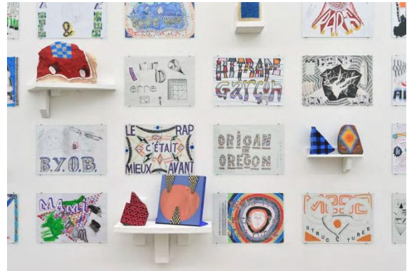
Genêt Mayor Maintenant (détail), 2013, peinture murale, bois et vue de l'exposition «Tempo Giusto», 2012, Galerie Sammy Abraham, Paris