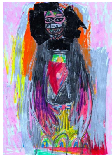
Viktor Korol, Untitled , 2017, craie grasse, scotch sur papier, 21 x 29,7 cm